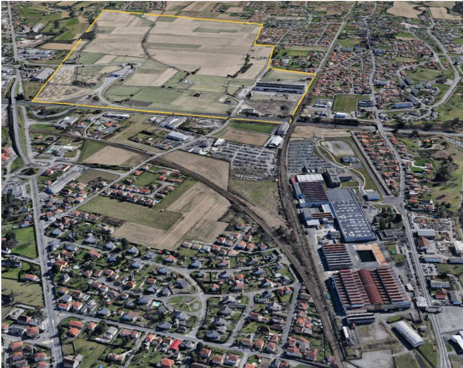
Vue du Parc de l'Adour depuis le Nord. Au premier plan le site ALSTOM Transports. Puis l'autoroute A64 Toulouse / Bayonne et l'échangeur n° 11 Tarbes-Est